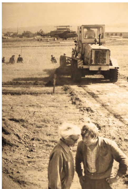
Строительство ВПП (взлётно-посадочной полосы), с. Кежма. 1980-1981