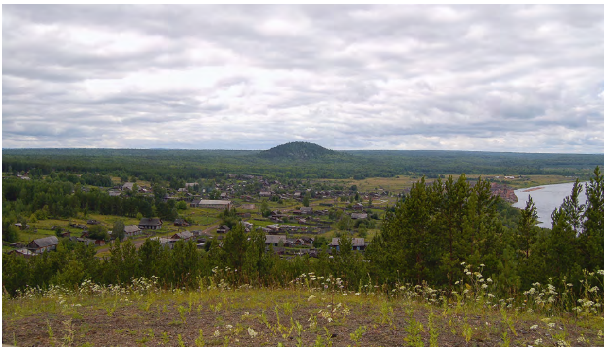
Вид на п. Болтурино с Лысой «горки»