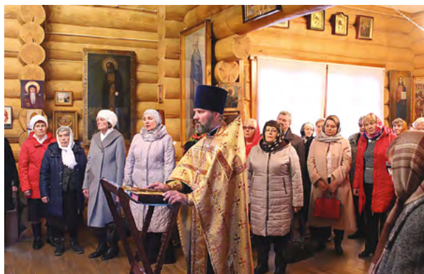
День благодарения Малой Родины. Молебен в Свято-Знаменском храме. г. Дивногорск. 2017