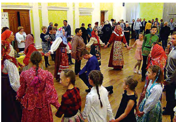
Мастер-класс на мероприятии «День благодарения Малой Родины». 2017