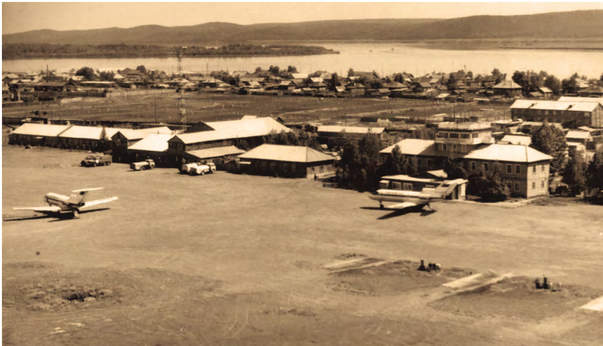
Вид на Кежемский аэропорт. 1980-е