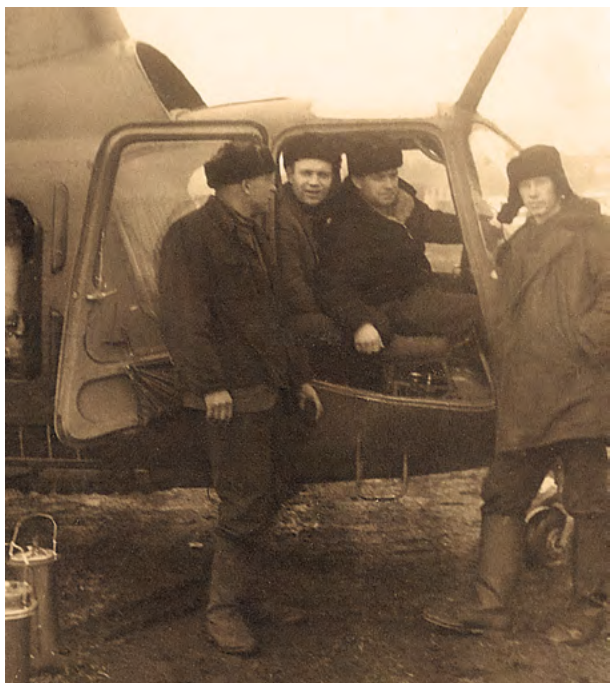
Подготовка вертолётa Ми-1 к полёту завершена. Начало 1960-х