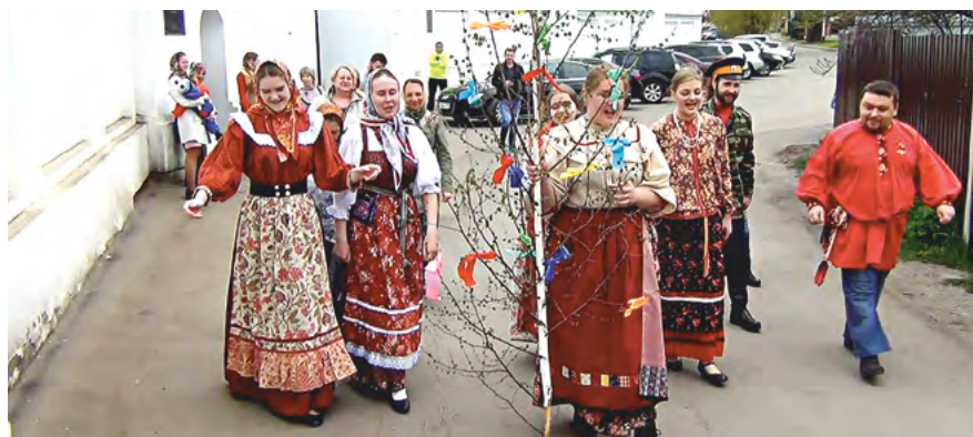
Фольклорный ансамбль «Живая старина» проводит троицкий обряд с берёзой. Фестиваль старожильческих народов Красноярского края. 2018