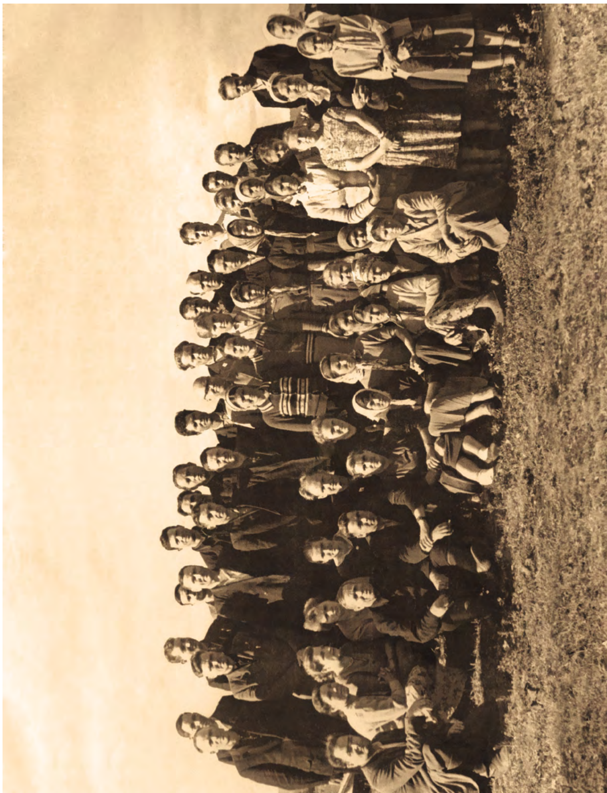
Совещание животноводов. д. Аксёново. 1975