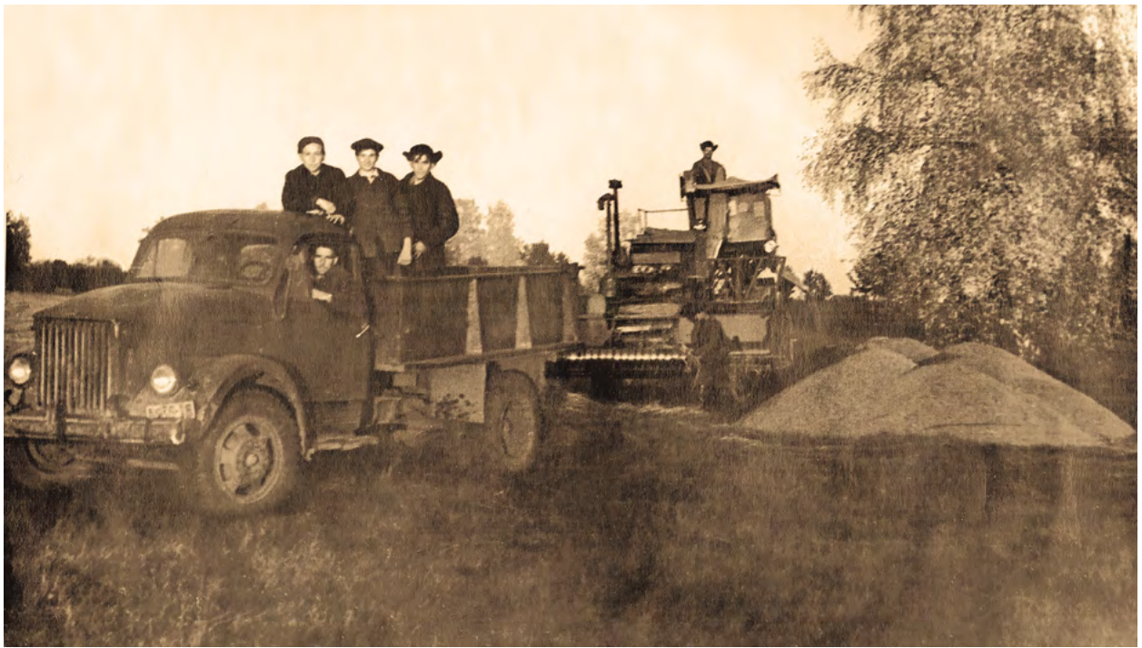
Выгрузка хлеба из комбайна