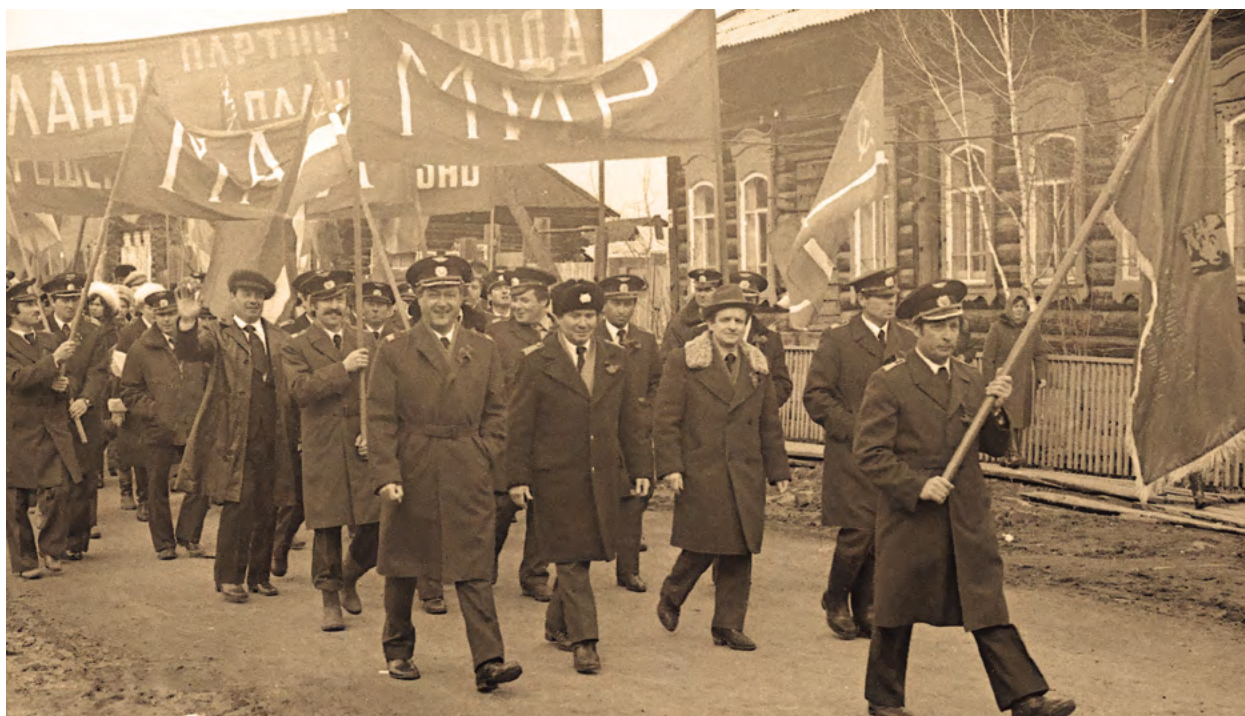
Колонна Кежемского ОАО на первомайской демонстрации. с. Кежда. 1980-е