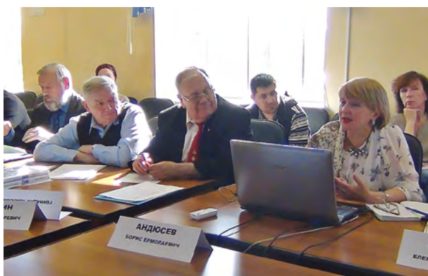
Круглый стол в рамках Фестиваля старожильческих народов Красноярского края. 2018