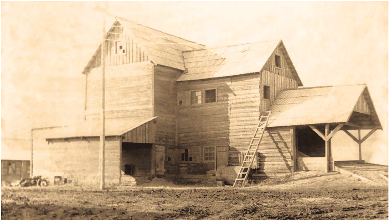
Зерносушилка колхоза «Заветы Ильича», с. Кежда. Начало 1970-х