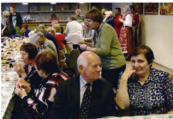
Чаепитие на мероприятии «Русские старожилы Сибири». 2018