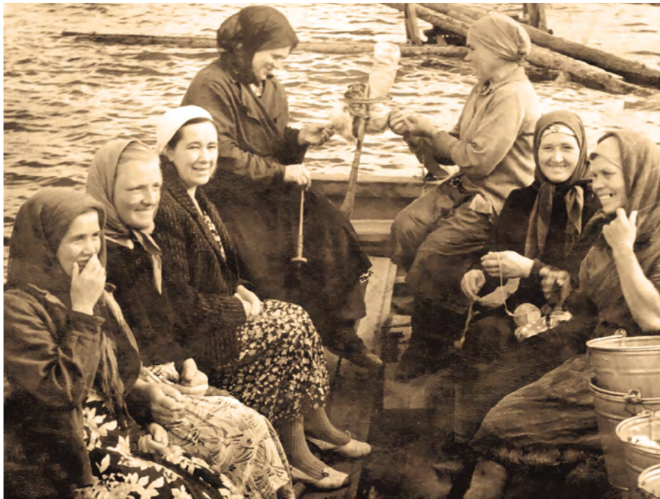
Доярки плывут на дойку. 1950-1960-е