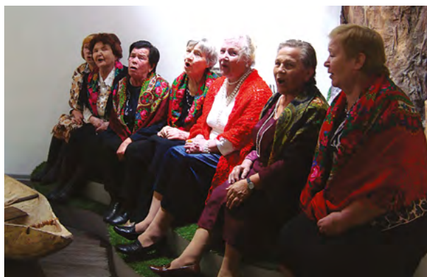
Ангарцы исполняют старинные песни на открытии новой экспозиции Литературного музея. г. Красноярск. 2014