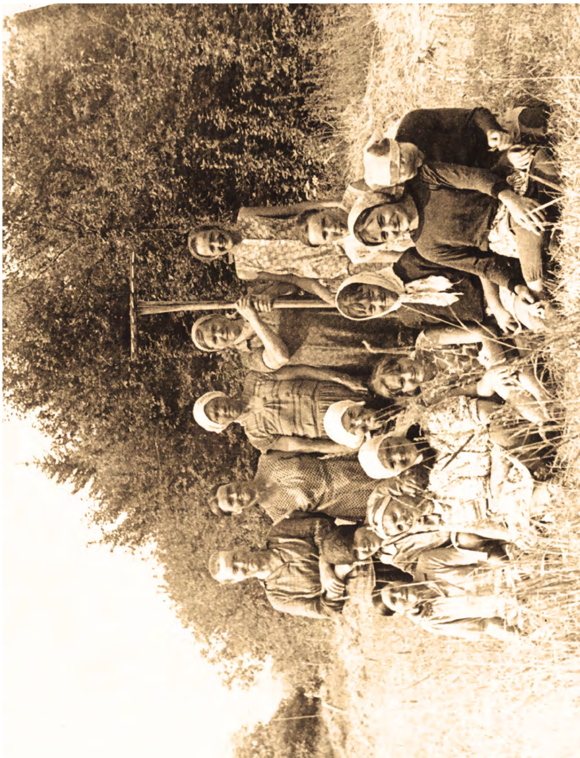
На покосе. с. Паново. 1970-е