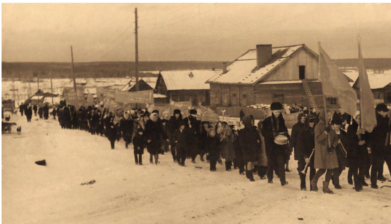
Демонстрация 7 ноября в п. Болтурино. 1970-е