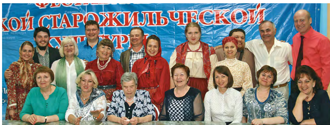
Первый Фестиваль старожильческих народов Красноярского края. г. Кодинск. 4 июня 2016 года