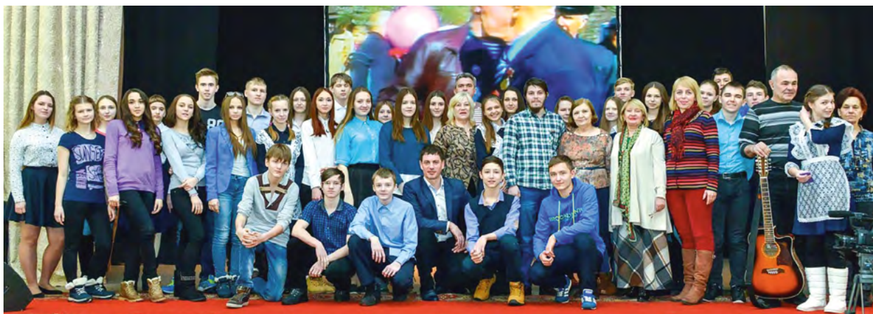
Встреча со старшеклассниками школ г. Кодинска. 2016