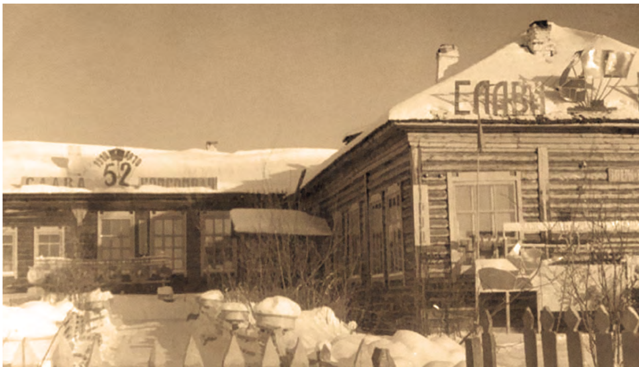
Школа в д. Фролово. Начало 1970-х