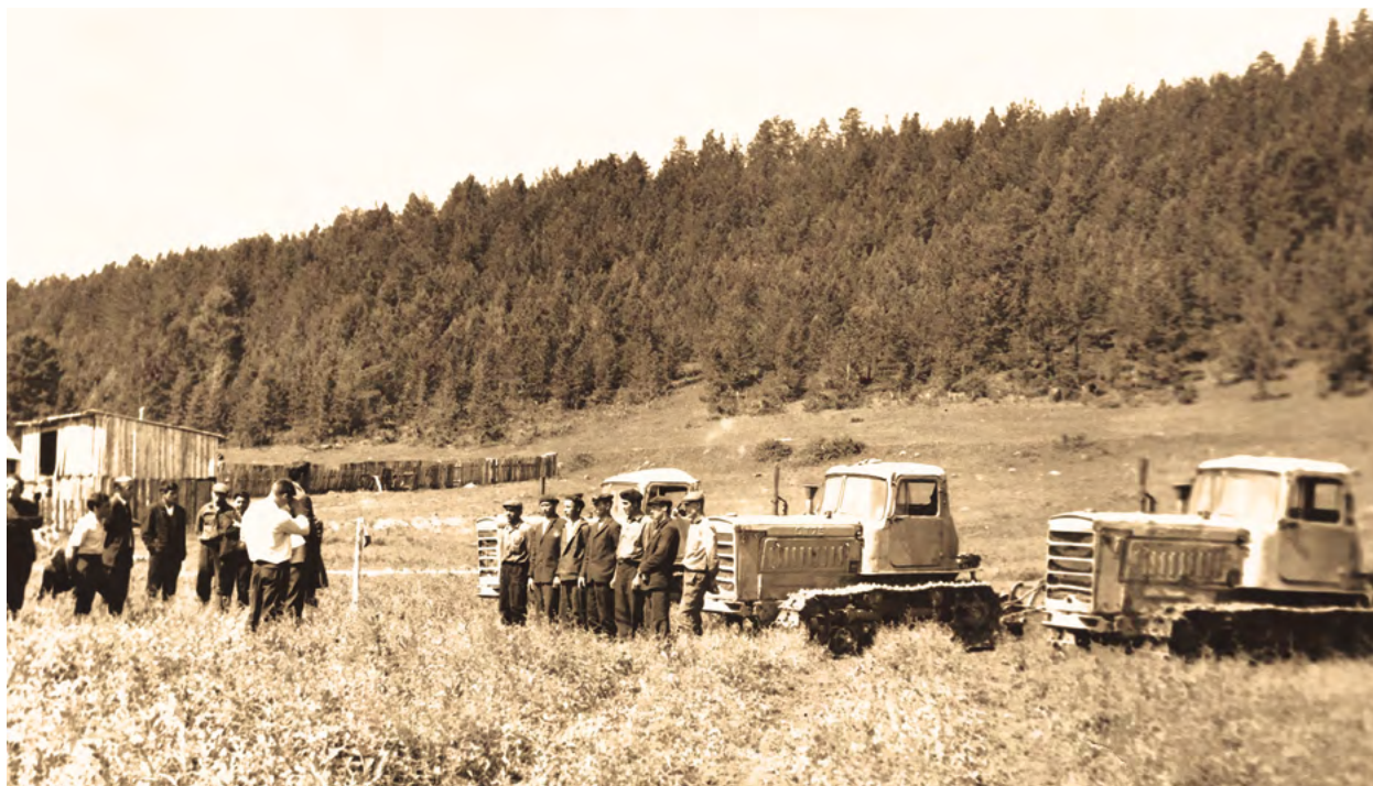
В колхозе «Пробуждение», с. Паново. 1970-е