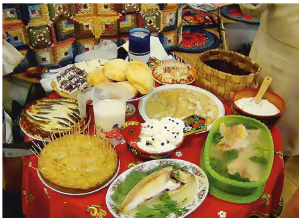
Выставка-дегустация ангарских блюд