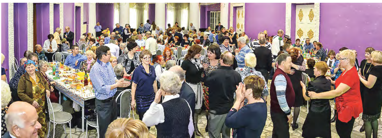
Встреча земляков. Группа «Кежма». г. Красноярск. 2014