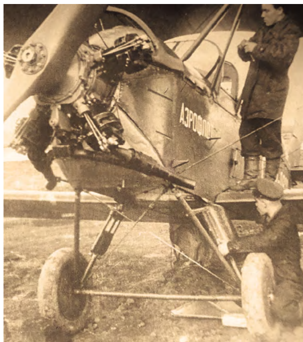
Периодическое техническое обслуживание По-2. 1950-е