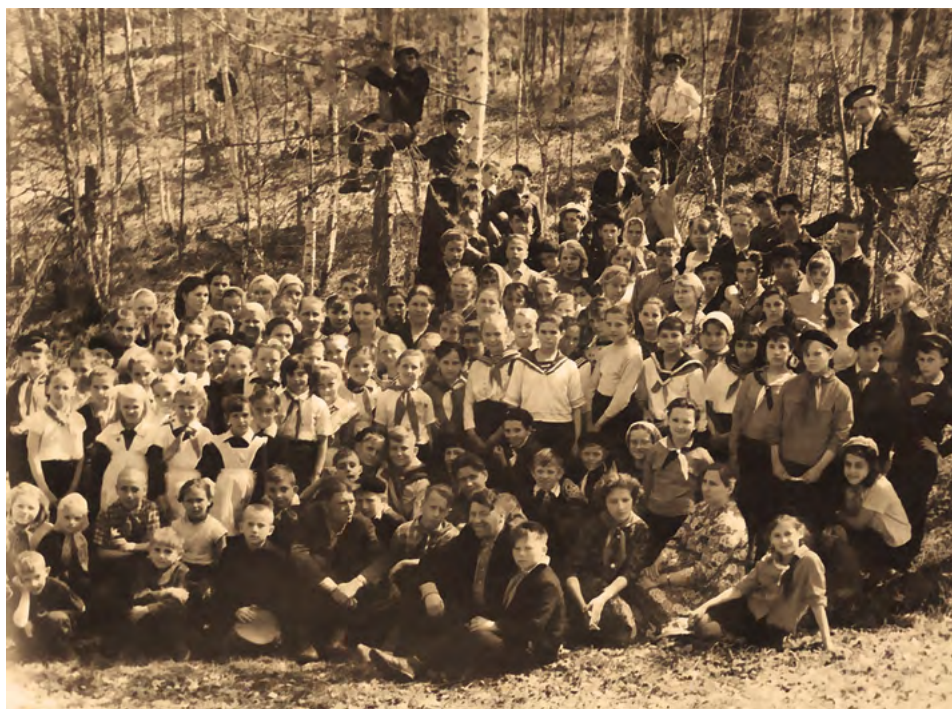
День Пионерии в Проспихинской средней школе. 1960-е