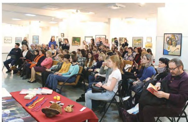
Этноурок в Международный день родного языка. Дивногорский художественный музей. 2019