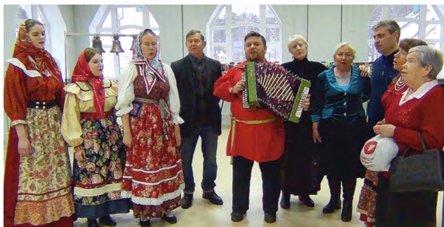
Мастер-класс на мероприятии «Русские старожилы Сибири». 2018